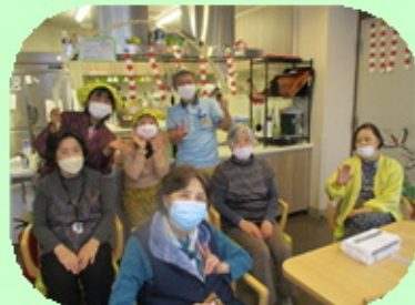
【みんなで記念撮影】