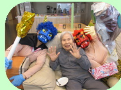
【鬼は内、福も内、みんな仲良く 過ごしています】