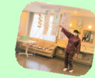
【職員による南京王すだれ】