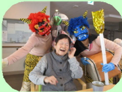
【豆まきの様子です。 元気な鬼が遊びにきました！】