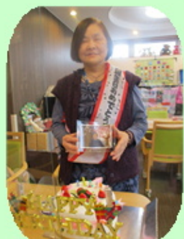
【お誕生日おめでとうございます】