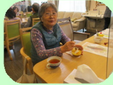
【お誕生日会のオヤツは マンゴープリンでした】