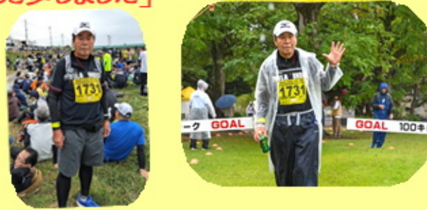
日頃は、デイサービスとショートステイの 送迎を担当しています。