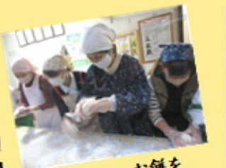
【つきたてのお餅を 丸めています】