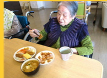
【いなり寿司からいただきます！】