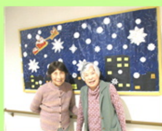
【巨大壁画の完成です】