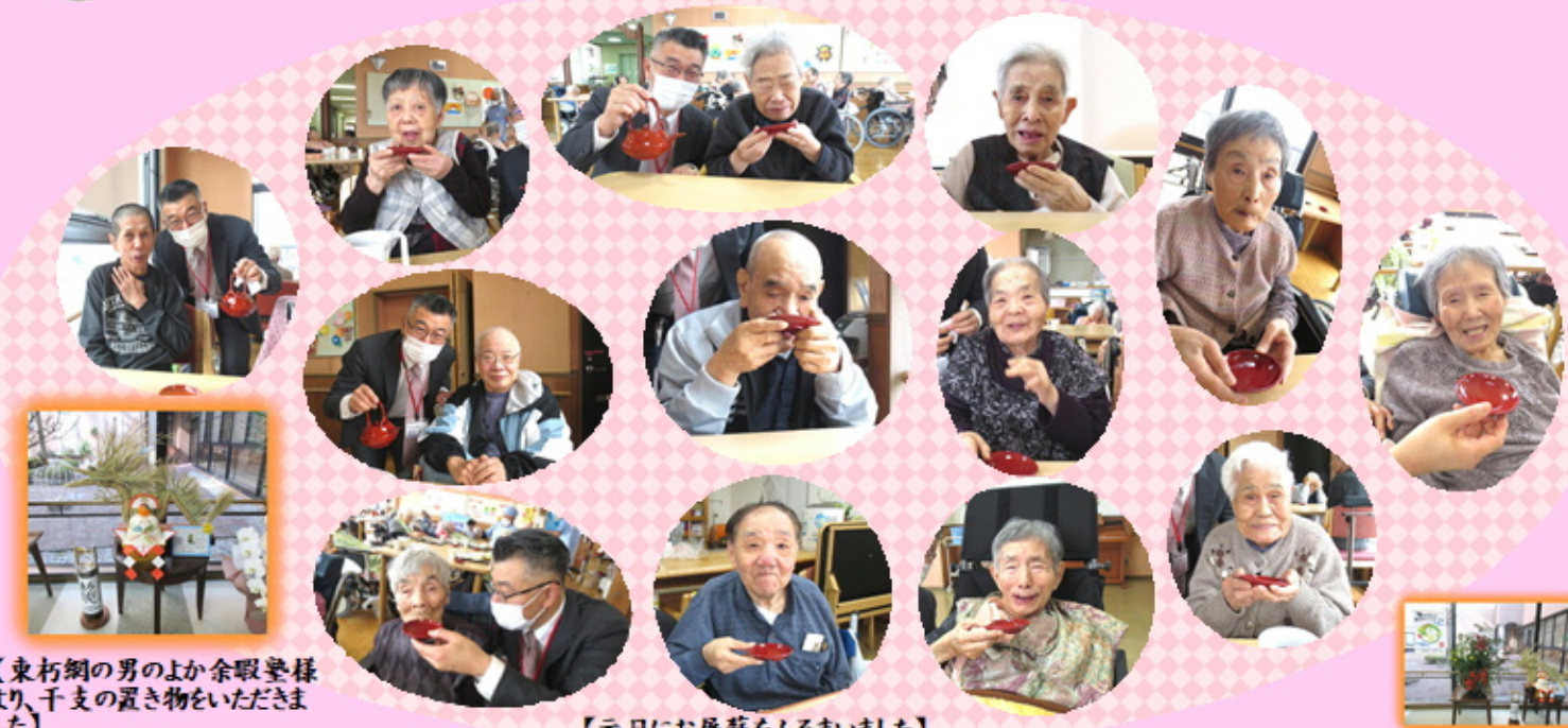
【東朽網の男のよか余暇望様 より、干支の置き物をいただきました】