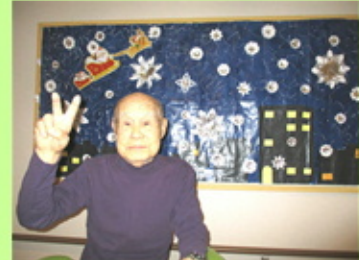
【みんなで壁画を作りました】