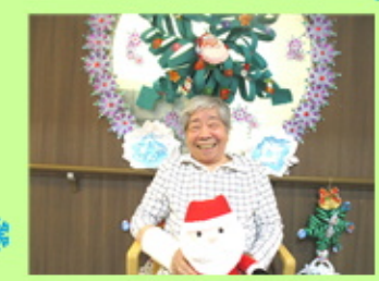
【とびきりの笑顔です】