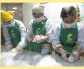
【きれいな丸餅が どんどん出来ています】