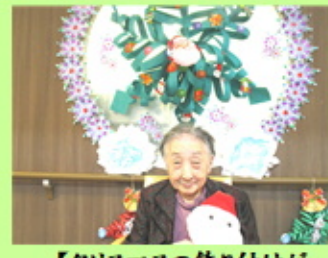
【クリスマスの飾り付けが 完成しました！】