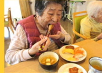
【お味はいかがですか】