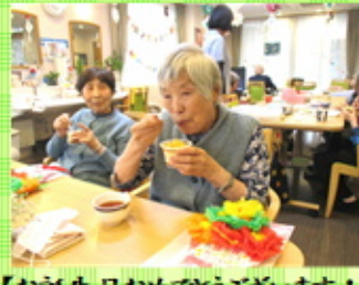
【お誕生日おめでとうございます！】