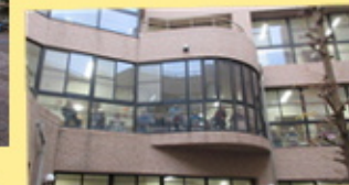
【2階、3階からご利用者様も 見学しています】

令和5年12月16日、4年ぶりにお餅つきが行われました。 ご家族様や曾根新田の地域の方や曾根東ウェルクラブの関係者や 児童の方が参加していただきました。 出来上がったお餅で白餅、す餅、あんこ餅、きなこ餅を作りました。 久しぶりにお餅つきをして、みなさまに喜んでいただきました。