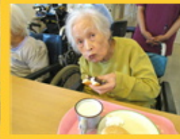
【クリームがたっぷりです】 【あなたもお食べなさい】