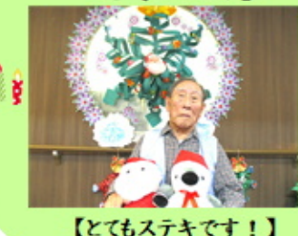
【とてもステキです！】