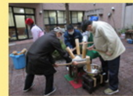
【さあ！心をこめて お餅をつきますよ！】