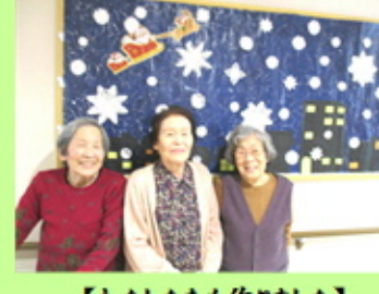
【わたしたちも作りました】