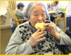
【これは美味しいわ！】