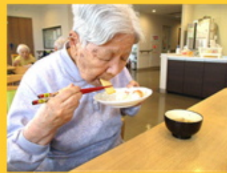
【お寿司は食がすすみますね】