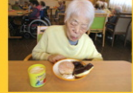
【目を閉じて味わいます】