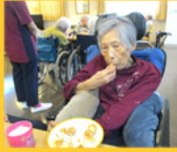
【甘いものは好きです】