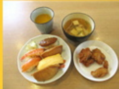
【お寿司セットの完成です！】