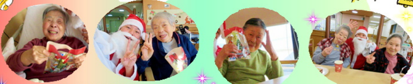
プレゼント、ありがとう。