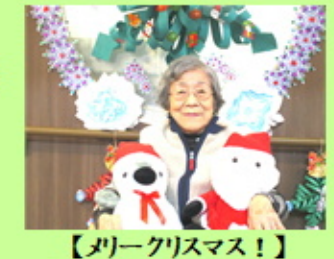
【メリークリスマス！】