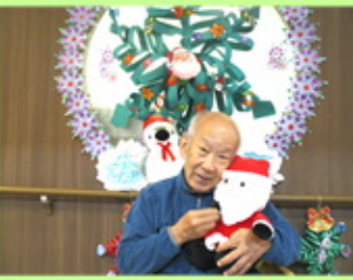
【このサンタ気に入ったよ！】