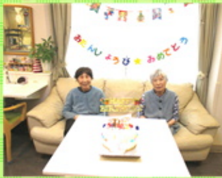
【12月 生まれがお二人 いらっしゃいました】