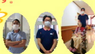
私達も九州マラソン 頑張ります！