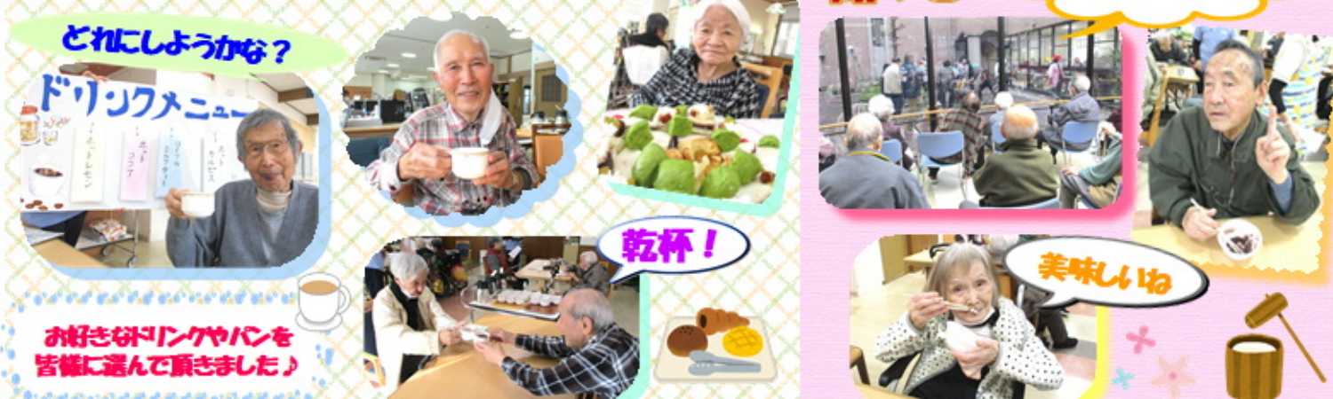
どれにしようかな？