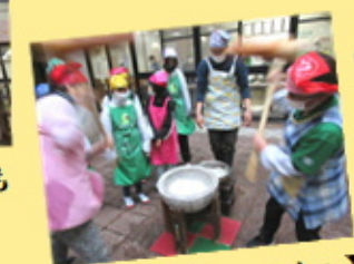
【完成まであと少しです！】

令和5年12月16日、4年ぶりにお餅つきが行われました。 ご家族様や曾根新田の地域の方や曾根東ウェルクラブの関係者や 児童の方が参加していただきました。 出来上がったお餅で白餅、す餅、あんこ餅、きなこ餅を作りました。 久しぶりにお餅つきをして、みなさまに喜んでいただきました。