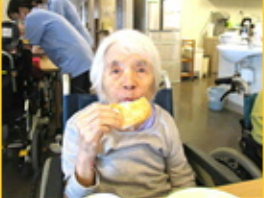
【クリームがたっぷりです】 【あなたもお食べなさい】