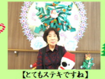
【とてもステキですね】